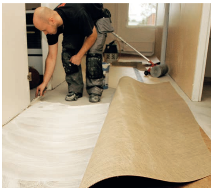
Muovipäällysteet ja linoleumit kiinnitetään ARDEX M1-luokitelluilla päällysteliimoilla.