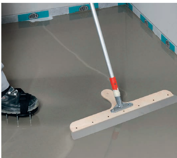
ARDEX K 40 ja ARDEX K 33 ovat M1-luokiteltuja tasoitteita, joilla saadaan helposti valmis pinta päällysteelle.

Peitelevyjien ja -listojen kiinnittäminen tehdään vaurioittamatta tiivistystä. Asennusliimalla tehtävät listakiinnitykset tehdään ARDEX CA 20 P -asennusliimalla. Asennusliima on nopea, polymeeripohjainen ja ylimalattavissa.